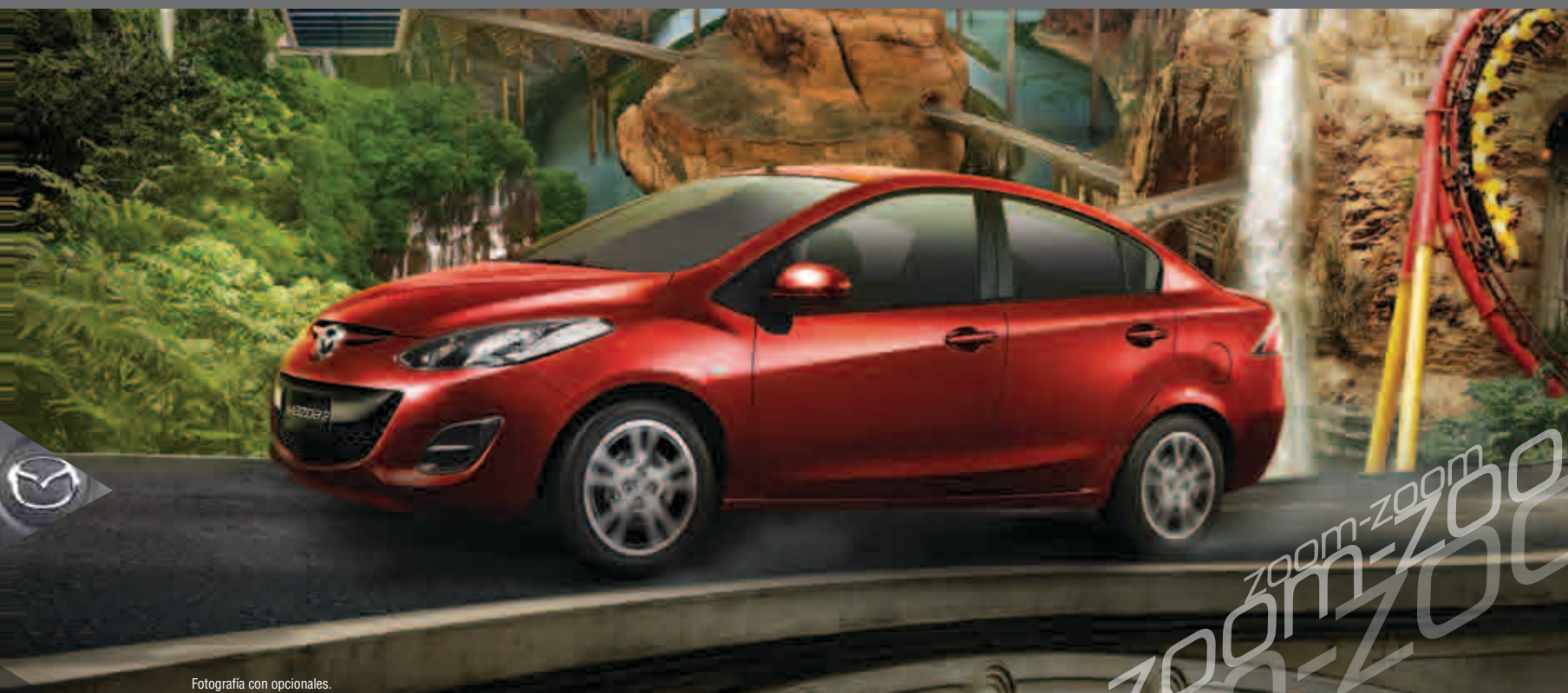
Fotografía con opcionales.