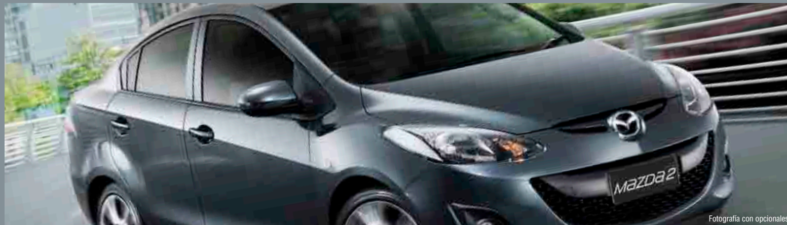
Fotografía con opcionales.