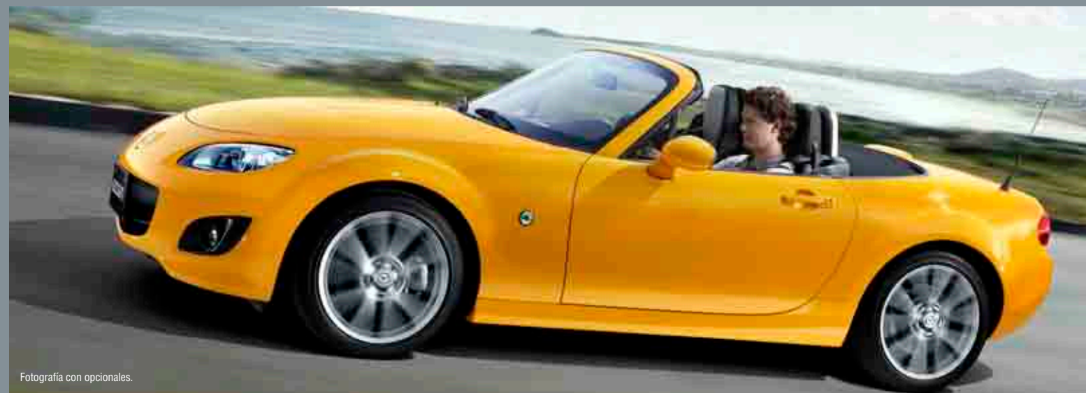
Fotografía con opcionales.

X: estándar -: no disponible O: opcional