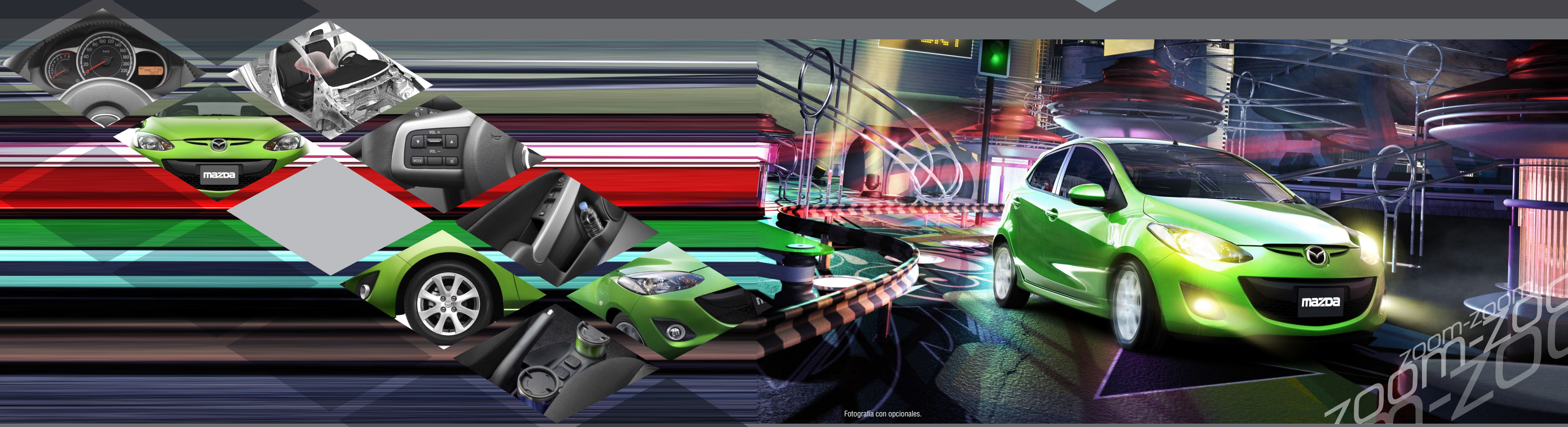
Fotografía con opcionales.