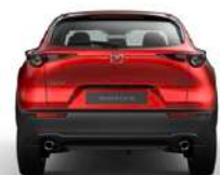
NEW MAZDA CX-30